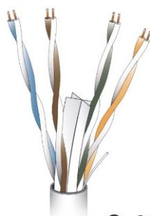
Cat6 Cu Data Cable